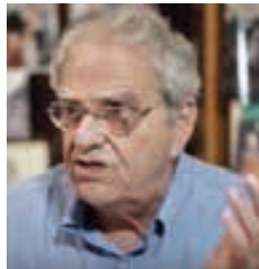
Το Δημήτρη Αλευρομάγειρου, Αντιστρατήγου ε.α. Επίτιμου Γενικού Επιθεωρητού Στρατού.[*]

Τ ο Κυπριακό είναι το κορυφαίο εθνικό μας θέμα εδώ και 100 και πλέον χρόνια και εξακολουθεί να παραμένει.