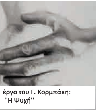
έργο του Γ. Κορμπάκη: "Η Ψυχή"

«Άκου, Ανθρωπάκο» σε μετάφραση Δημ. Παπαδημητρίου)