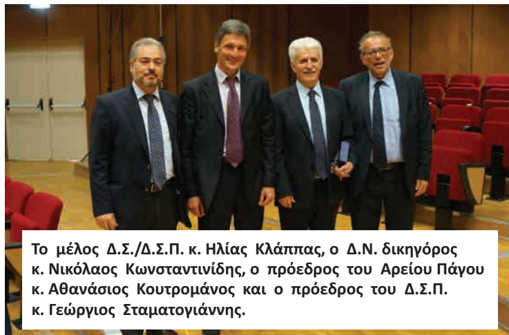
Το μέλος Δ.Σ./Δ.Σ.Π. κ. Ηλίας Κλάμπας, ο Δ.Ν. δικηγόρος κ. Νικόλαος Κωνσταντινίδης, ο πρόεδρος του Αρείου Πάγου κ. Αθανάσιος Κουτρομάνος και ο πρόεδρος του Δ.Σ.Π. κ. Γεώργιος Σταματογιάννης.

προσωπικής γνωριμίας, κατά την επικοινωνία μεταξύ των προσώπων, που υλοποιούν αυτήν την δικαστική συνεργασία. Το στοιχείο της εμπιστοσύνης, αποτελεί τον ακρογωνιαίο λίθο για την επιτυχία της συνεργασίας αυτής. Για την γρήγορη και αποτελεσματική Διεθνή Δικαστική συνεργασία (σε ποινικά θέματα) απαιτείται η ύπαρξη κοινών κανόνων δικαίου. Απαιτείται κοινή εκπαίδευση, ειλικρινής και αμοιβαία εμπιστοσύνη, καθώς και συντονισμός. Πάνω απ' όλα όμως απαιτείται θέληση και προθυμία για δικαστική συνεργασία.