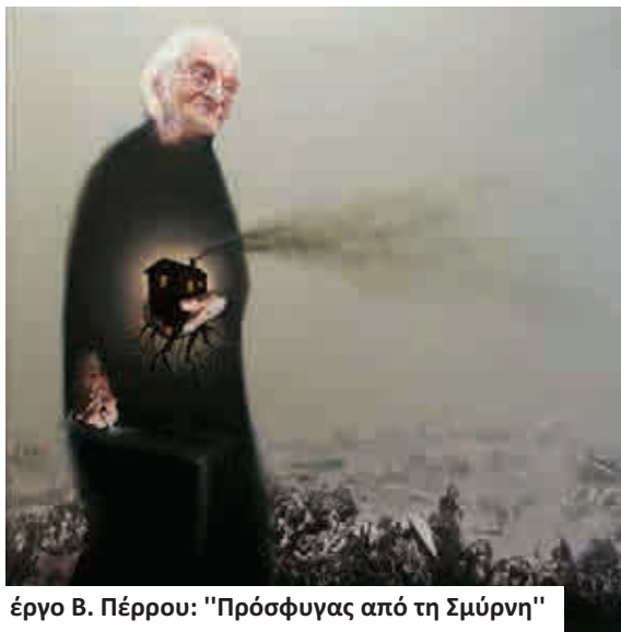
έργο Β. Πέρρου: "Πρόσφυγας από τη Σμύρνη"

ποινικά κολάσιμες, καταλογιστές κι εύκολα αναγνωρίσιμες αλλά και στην εγκληματική σιγή του «πολιτισμένου» κόσμου που μέσω της αδράνειας τόσων ετών, της ανοχής ή και των παραλείψεών του, συνδράμει στην τέλεση ενός συλλογικού διαρκούς εγκλήματος παραλείψεως κατά της ανθρωπότητας. Εγκλήματος που ενέχει στοιχεία ενέργειας καθώς η αέναη ανανέωση του κινδύνου προσδίδει στην μη άρση του και τον χαρακτήρα της μη αποτροπής του.