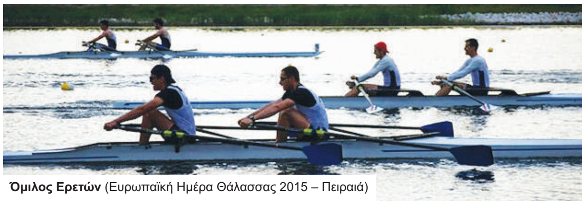
Όμιλος Ερετών (Ευρωπαϊκή Ημέρα Θάλασσας 2015 – Πειραιά)

Ο Όμιλος Ερετών με πρωτοβουλία του διοργάνωσε Αγώνες Κωπηλασίας, στο πλαίσιο της «Ευρωπαϊκής Ημέρας Θάλασσας 2015 – Πειραιά», την Κυριακή 31 Μαΐου . Οι αγώνες διεξήχθησαν στο Φαληρικό όρμο , με ανοικτή συμμετοχή Σωματείων και Αθλητών. Η εκκίνηση έγινε στον όρμο του Λουβιάρη ή « Σκαφάκι » και ο τερματισμός στη Μαρίνα Ζέας . Απονομή των μεταλλίων στις εγκαταστάσεις του Όμιλου Ερετών έγιναν την ίδια ημέρα. Στους αθλοθέτες μετείχε και ο Δικηγορικός Σύλλογος Πειραιά.