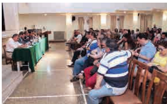
Στιγμιότυπα από την ενημερωτική εκδήλωση