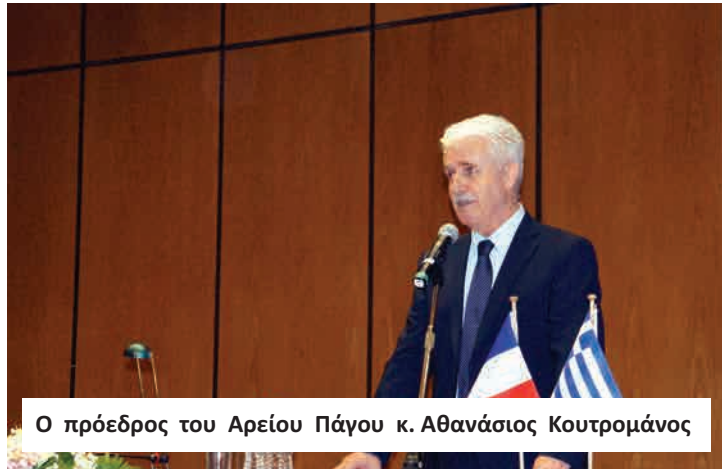
Ο πρόεδρος του Αρείου Πάγου κ. Αθανάσιος Κουτρομάνος

σιών, αλλά και διατάξεων Γαλλικού δικαίου, όπως και αποφάσεων του Δ.Ε.Κ.