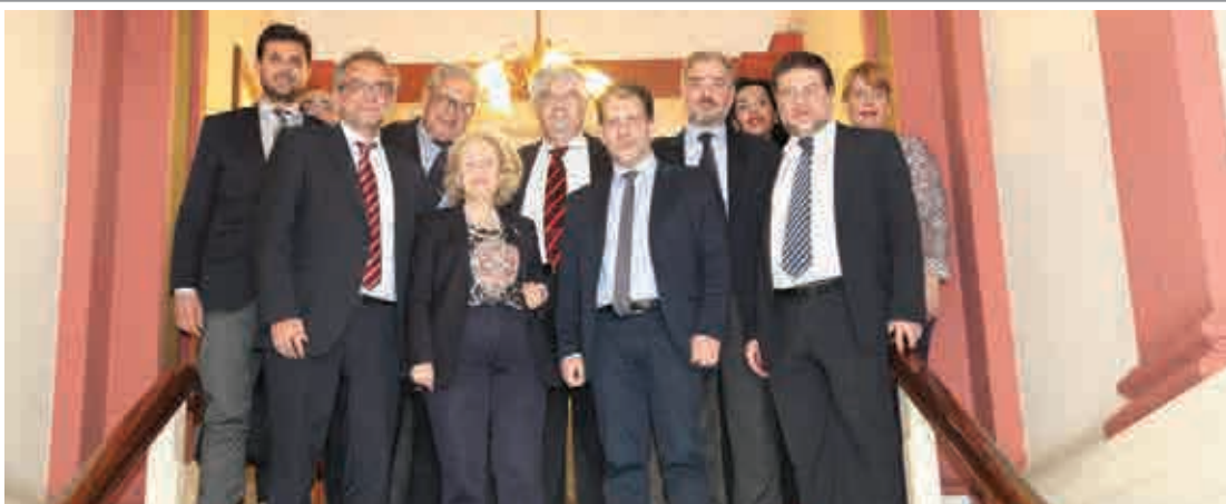
Ο Πρόεδρος και μέλη του ΔΣ του ΔΣΠ, με τον Γεν. Γραμ. του Υπουργείου Δικαιοσύνης κ. Κωνσταντίνο Κοσμάτο και την Πρόεδρο και τον Αντιπρόεδρο της Ένωσης Δικαστών και Εισαγγελέων κ.κ. Βασιλική Θάνου-Χριστοφίλου και Ευάγγελο Κασαλιά, κατά τη επίσκεψή τους στον ΔΣΠ.

Ως εκ των ανωτέρω και με τον πρέποντα σεβασμό προς τη θεσμική Σας θέση και ιδιότητα, δηλώνουμε δυσαρεστημένοι με τη στάση Σας και αντίθετοι σε κάθε ηθελημένη ή ατυχή ενέργεια που έχει ως αποτέλεσμα να απαξιώνεται ο τρίτος μεγαλύτερος Δικηγορικός Σύλλογος της χώρας και να αγνοείται η νόμιμα εκλεγμένη Διοίκησή του.